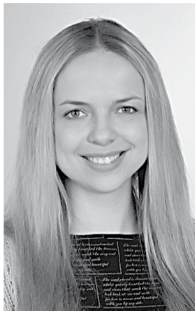
«Начав записывать траты, я задумалась. Нам многое не по карману!»

Сконцентрировать внимание решила на двух основных статьях расходов: питании и развлечениях. Теперь, прежде чем идти в магазин, я открываю холодильник, смотрю, чего не хватает, записываю, что нужно и в каком ко-