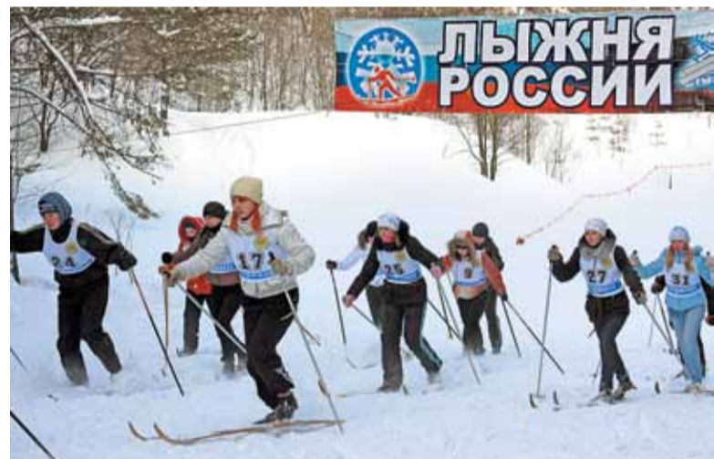
Уверенно — в будущее

Жители Анжеро-Судженска видят и по праву гордятся тем, что с каждым днем город преобразуется, становится более комфортным и благоустроенным, развивается в соответствии с велением времени. А это значит — все задуманные планы воплотятся в жизнь.