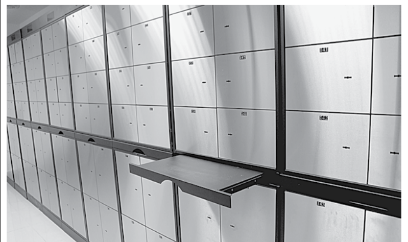
Температура здесь на 10 градусов ниже, чем в банке