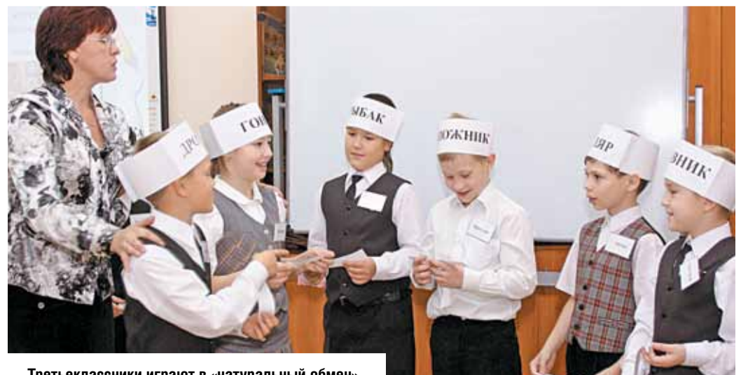
Третьеклассники играют в «натуральный обмен»