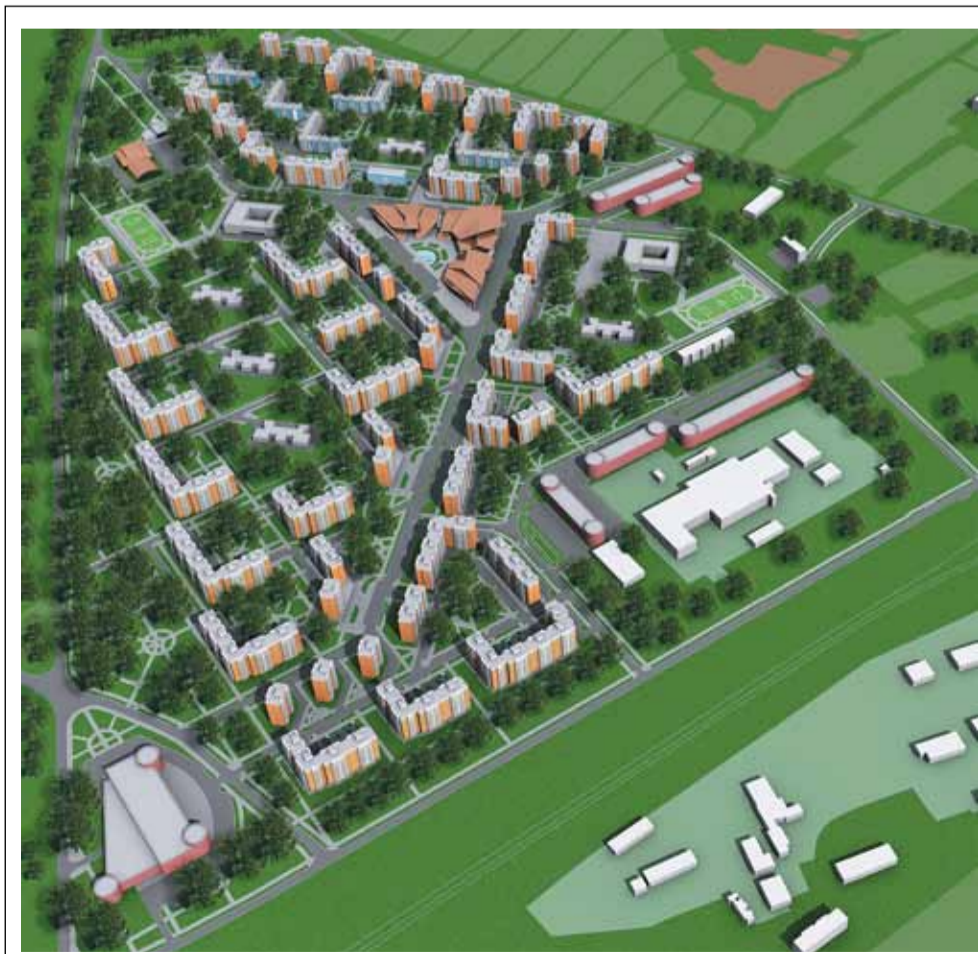
Перспективный план развития Восточного микрорайона города