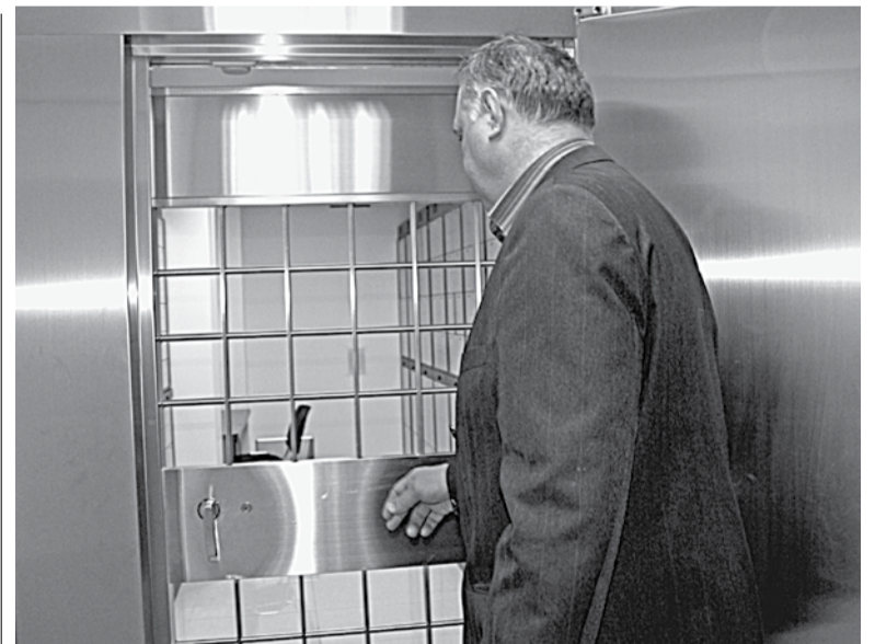
Массивная дверь — первый этап на пути в хранилище НМБ

Банк не несет ответственности, если содержимое ячейки будет повреждено по причине того, что имущество требует особых условий хранения (уровень влажности, температурный режим и прочие факторы).