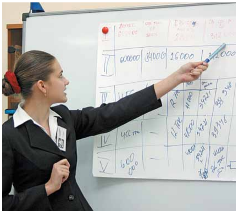
«Я знаю, как рассчитать свою жизнь»

Анжеро-Судженск стал знаковым для «ФК» городом. Именно сюда в октябре текущего года прибыл Финансовый Экспресс