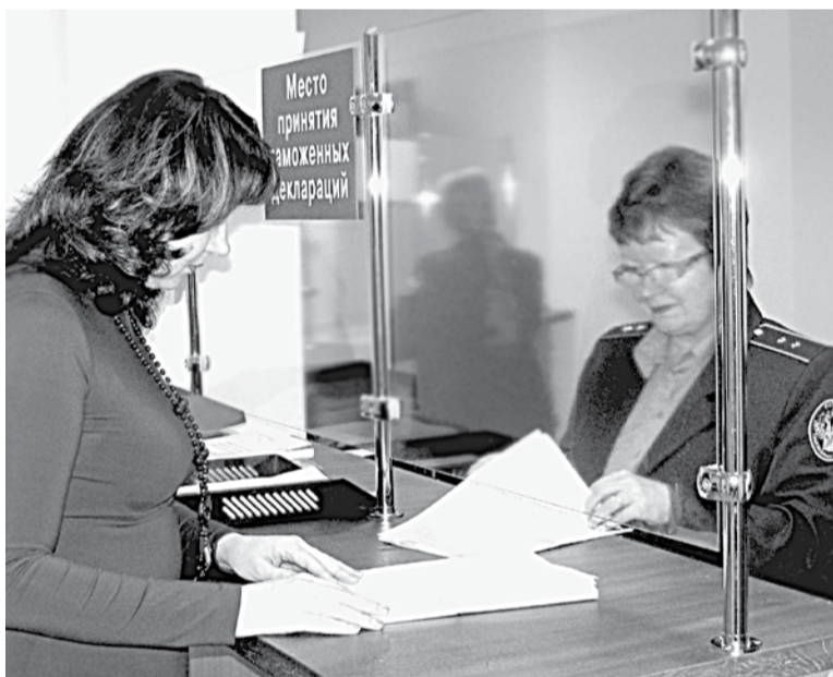
Аэропорт «Кемерово». Таможенный досмотр

ФК СОВЕТ: Отправляясь за границу, ознакомьтесь с полным перечнем товаров, к которым применяются запреты и ограничения при перемещении через таможню: www.customs.ru (сайт ФТС России), www.tsouz.ru (сайт Таможенного союза), или обратитесь в таможню за консультацией (предоставляется бесплатно). Правовой отдел Кемеровской таможни: (3842) 36-14-34, 36-94-68.