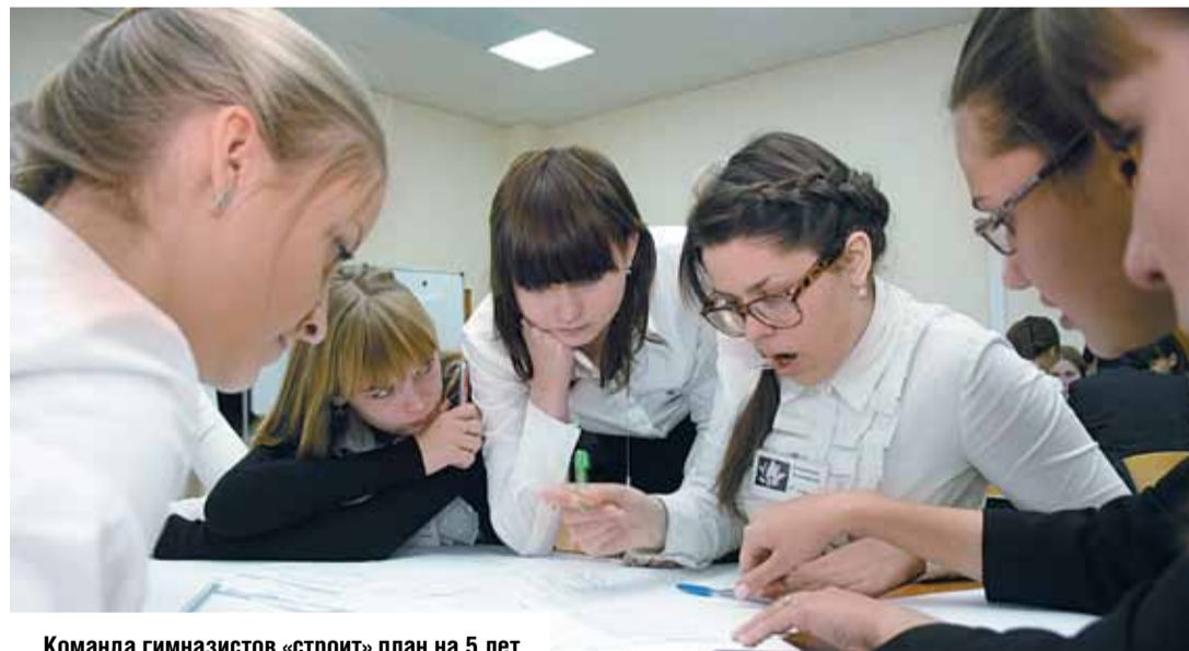
Команда гимназистов «строит» план на 5 лет

В городе 19 общеобразовательных учреждений и 27 детских садов. Дважды признана победителем регионального конкурса «Лучшие школы Кузбасса» гимназия №11.