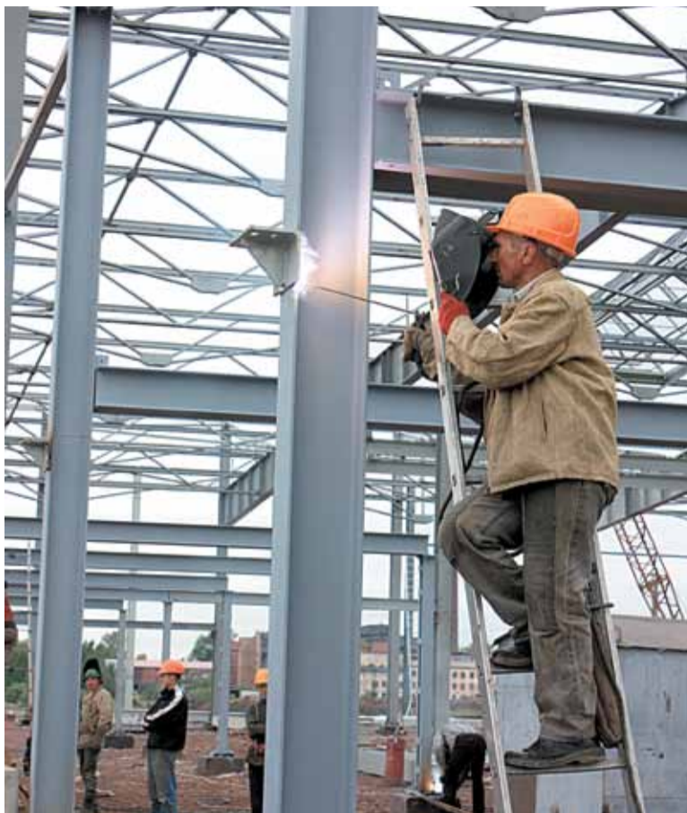
Город становится большой промышленной стройплощадкой

Помимо этого, в комплекс мероприятий, запланированных на 2011 год и претендующих на софинансирование из федерального бюджета, входит реконструкция городского водовода, капитальный ремонт части